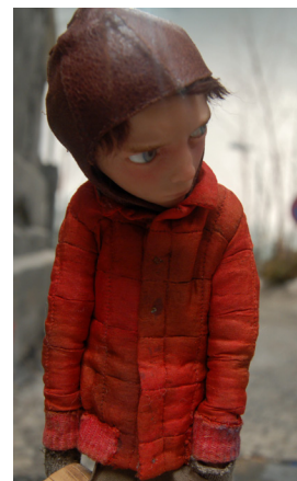
Fragment kadru z filmu Piotrus i wilk

W znajdującym się obecnie na terenie kompleksu EC1 Łódź budynku Centrum Komiksu i Narracji Interaktywnej swoją siedzibę miało studio Se-Ma-For Produkcja Filmowa. Było ono kontynuatorem tradycji Studia Małych Form Filmowych, w którym powstało Tango Zbigniewa Rybczyńskiego, nagrodzone Oscarem w kategorii najlepszy krótkometrażowy film animowany. Se-Ma-For to także koproducent nagrodzonego Oscarem w tej samej kategorii Piotrusia i wilka , animacji lalkowej w reżyserii Suzie Templeton. To właśnie w łódzkim studio powstały lalki wykorzystane w tym filmie.