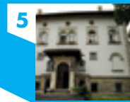
ul. ks. I. Skorupki 10/12

Wnętrze możliwe do zwiedzania po wcześniejszym uzgodnieniu. Do obiektu prowadzą schody.