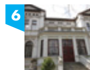
ul. Wólczańska 213

Wnętrze możliwe do zwiedzania po wcześniejszym uzgodnieniu. Do obiektu prowadzą schody.