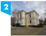
ul. Wólczańska 199

Obiekt przyjazny osobom niepełnosprawnym : windy, toalety.