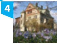
ul. ks. I. Skorupki 6/8

Wygodne alejki zachęcają do spacerów, lecz czasem pojawiają się przeszkody – stare korzenie drzew przebijają się przez asfaltowe ścieżki.