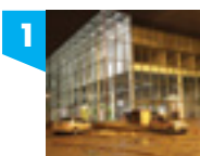
al. Politechniki 2

Część wymienionych obiektów jest dostępna (codziennie lub okazjonalnie) do zwiedzania dla osób poruszających się na wózkach inwalidzkich oraz z innymi formami niesprawności ruchowej. Pozostała część, z racji obecnego przeznaczenia (funkcja mieszkalna) nie jest przystosowana w odpowiedni sposób. Główną barierę stanowią schody prowadzące do poszczególnych obiektów. Można oglądać je jednak swobodnie z zewnątrz podziwiając ich monumentalność oraz bogactwo detali architektonicznych.