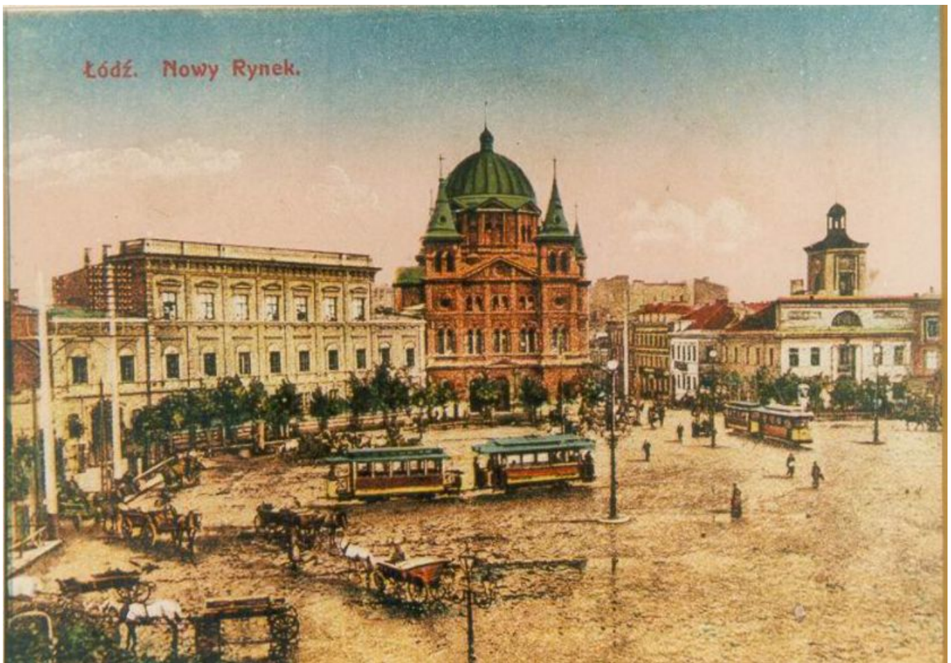
Nowy Rynek (ob. Plac Wolności)

Łódź to miejsce, które swój najbardziej burzliwy rozwój przeżywało na przełomie XIX i XX wieku. Jak wtedy wyglądało nasze miasto? Wybierz się razem z nami w podróż w przeszłość i zobacz Łódź na starej pocztówce!